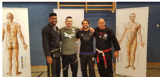
Selbstverteidigungskurs am Portfoliotag

vier Wochenstunden in Klasse 5 und 6 AGs: Akrobatik, Rugby, Tanz ausgebildete Sporthelfer einwöchige Sportfahrt in Klasse 10 schulinterne Turniere Teilnahme an Sportwettbewerben Sport-Aktions- und Gesundheitstage bewegungsreiche Pausengestaltung Mittagspausenspiele Präventionsprogramm Fit4future teens gesunde, abwechslungsreiche Pausen- verpflegung im Café Luise